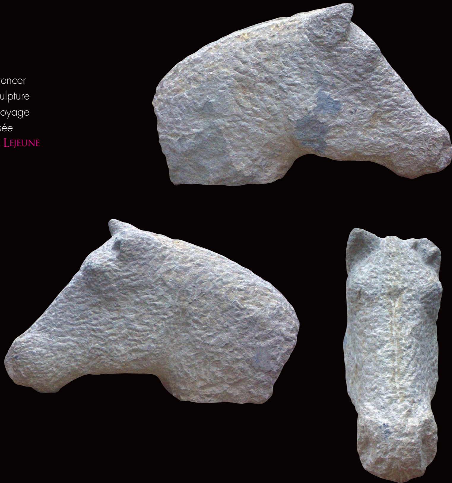
TETE DE CHEVAL ----- Calcaire de Bourgogne - Massangis 53x15x35 cm

Partir Commencer une sculpture Long voyage Traversée SYLVIE LEJEUNE