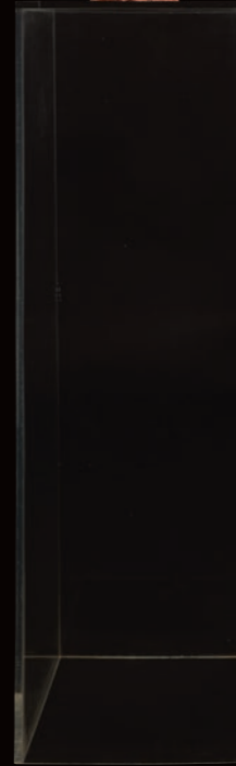
AUTO PORTRAIT AU CHAMPIGNON

Marbre de Caunes - Minervois 22x17x29 cm