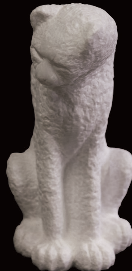
ETOSHA Marbre de Carrare 8x8x38 cm